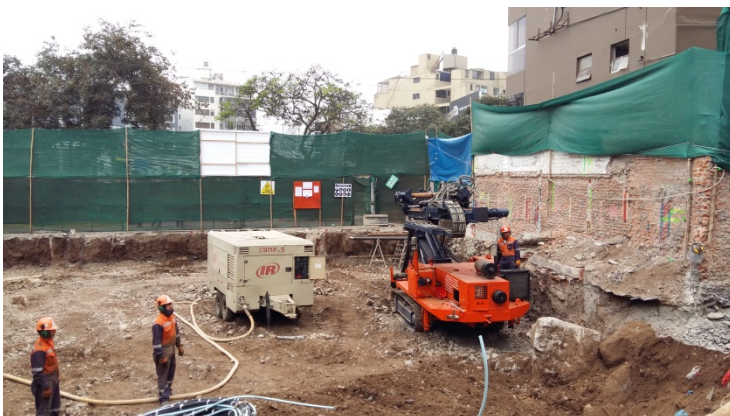
Inicio de trabajos en el primer anillo.

La Constructora encargada de realizar los trabajos de Muros Anclados fue GL Constructores.