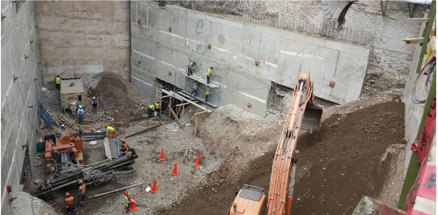
Perforaciones en el cuarto anillo con Mustang A4.

El Centro Empresarial Volterra, ubicado en el distrito de San Isidro, será un edificio de 10 pisos, 570 m 2 de área y 06 sótanos utilizó como sistema de entibación la tecnología del Muro Anclado en todo el perímetro de la excavación que consiste en una estructura de contención flexible que implica la construcción de muros por fases. Durante toda la excavación de la obra se ha venido encontrando grava semidensa.