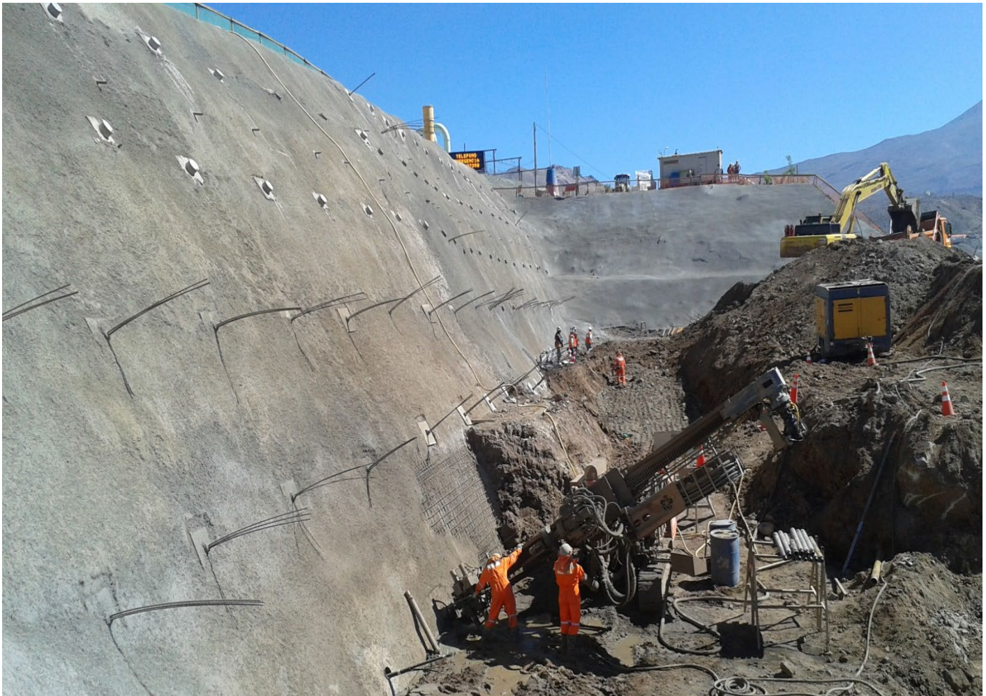
Vista general de la obra.

La obra fue siendo incrementada durante el transcurso de la misma, incorporando una 6ta. línea de perforación llevando la producción a un total de 140 cabezas permanentes, 3.200 ml de anclajes permanentes, más la ejecución de 570 ml de drenes.