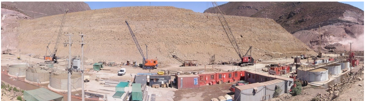
Vista general de la ejecución del Muro Pantalla.