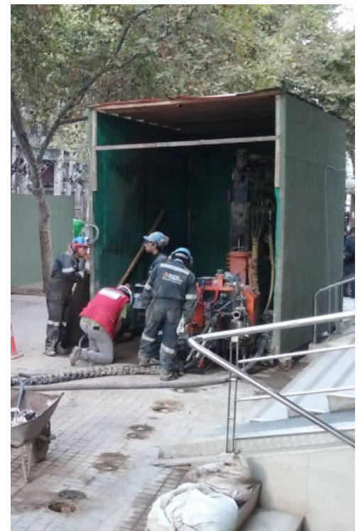
Vista de la Obra Estación Los Leones, inyecciones.