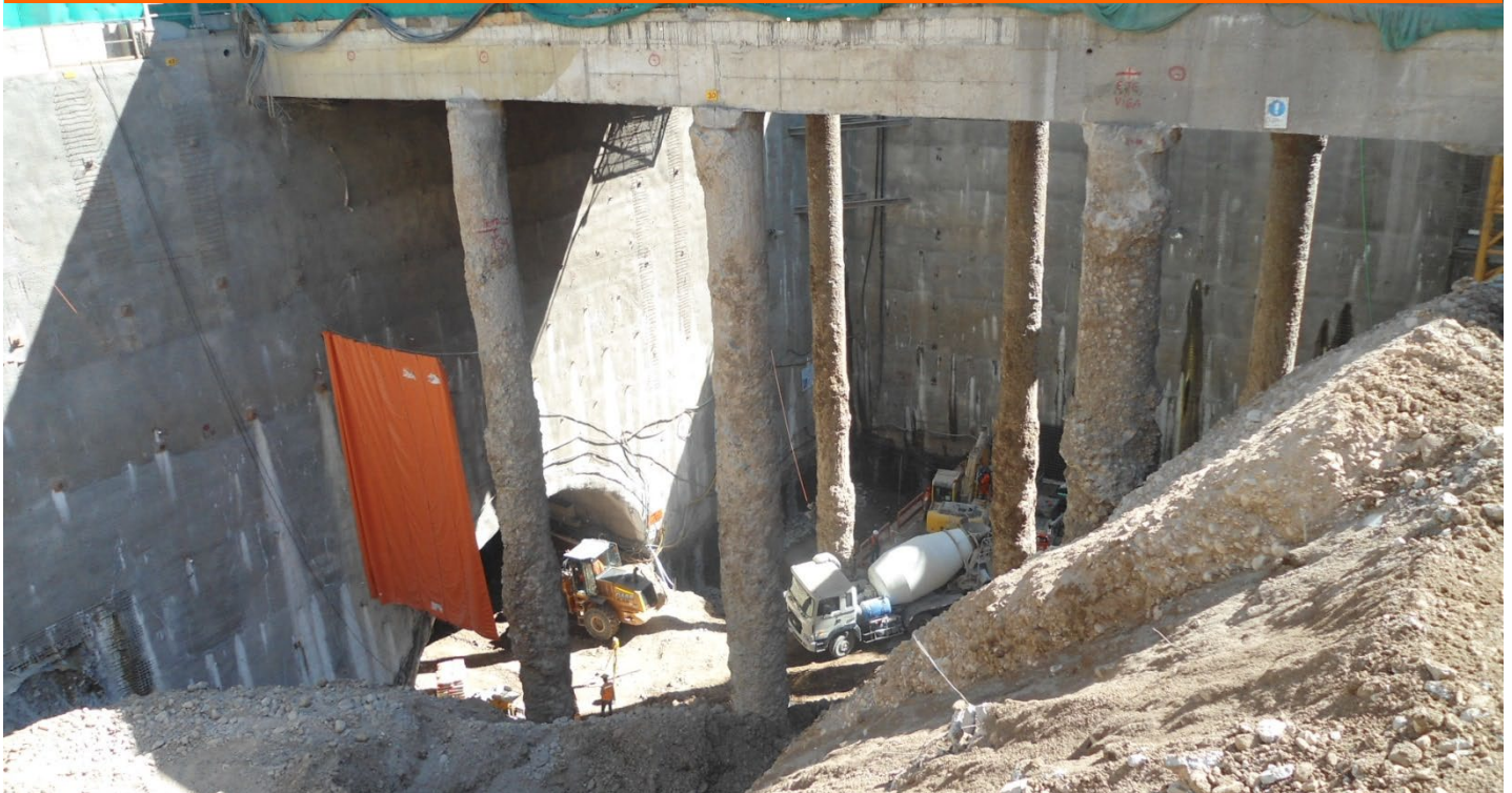
Foto 1 - Vistas de la Obra Estación Los Leones - Norte.