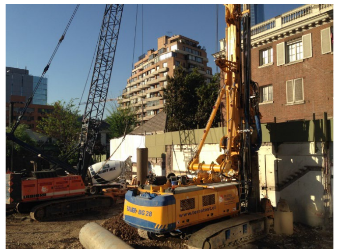
Fotos 2 y 3 - Vistas de la Obra Estación Los Leones - Sur.