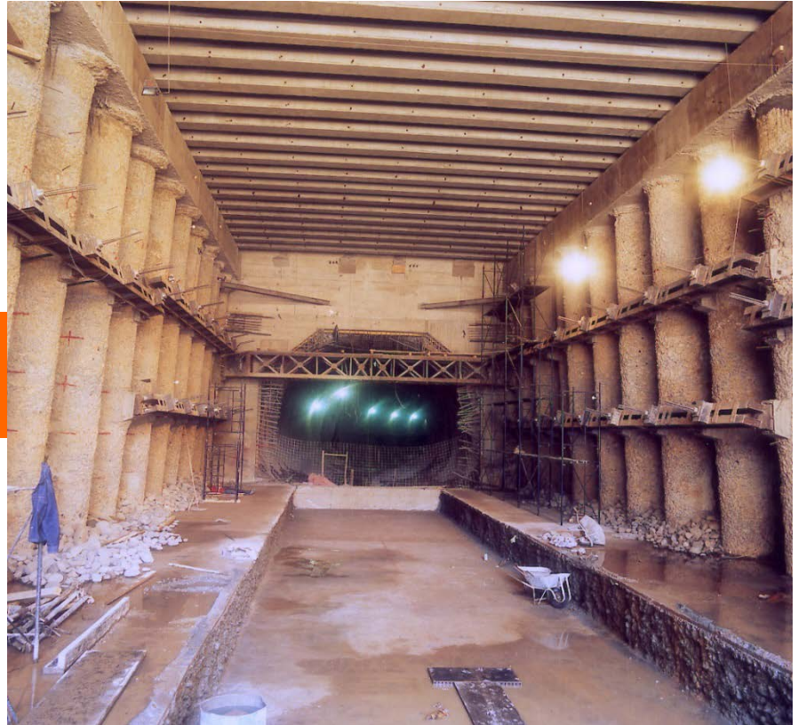
Foto 1 - Vista de la Obra.