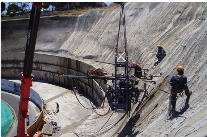
Instalación de Pernos Auto perforantes.