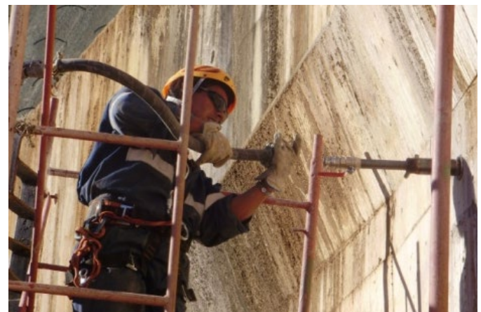
Inyección de Lechada en Trasdós del Muro.