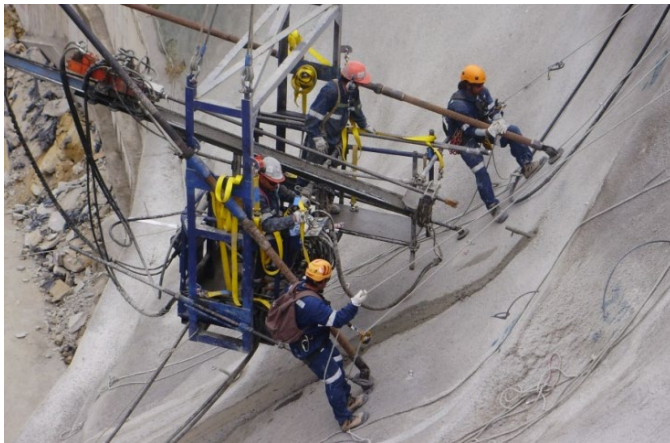
Fijación Canastillo de Perforación.