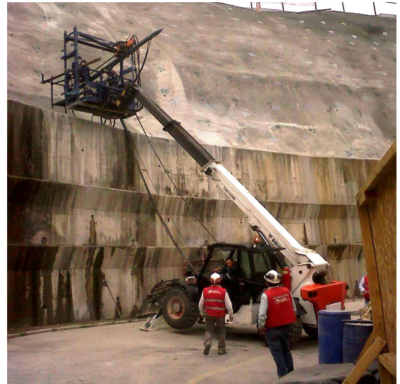
Ejecución de Pernos con Manipulador Telescópico.